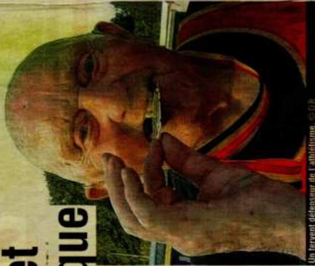
Un fervent défenseur de l'athlétisme.

« Mes meilleurs résultats, je les ai obtenus au saut à la perche où il me donnait également, à l'occasion, l'un ou l'autre bon conseil. Il était très patient avec ses athlètes, il ne s'énervait jamais. Un exemple pour nous. Il