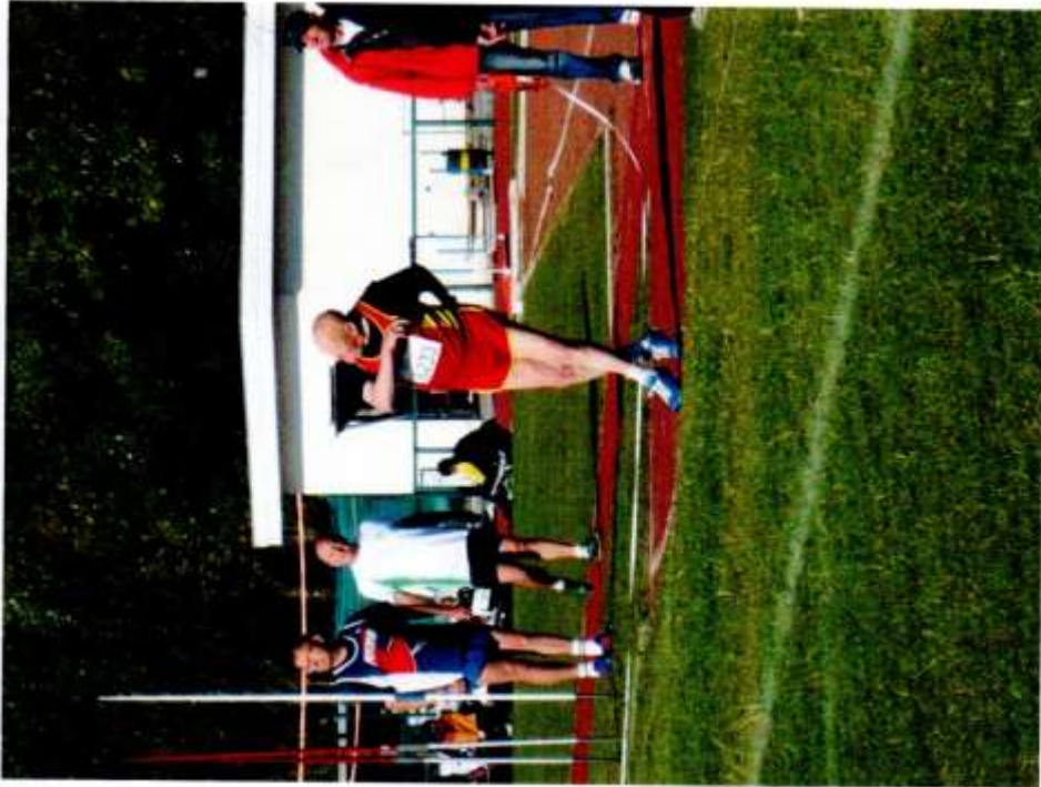
Au final, avec des dizaines de titres de champion francophone et de Belgique, le patriarche du GOSP s'est forgé un palmarès que beaucoup lui envient. La plupart de ses titres, il les a décrochés sur le tard. Un jour, il

nous avait confié, goguenard : « Plus j'avancé en âge et plus la concurrence se faisait rare. Quand on n'est pas particulièrement doué, comme c'était mon cas, il faut savoir durer pour sortir du lot. » Oh que oui !