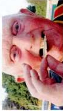
Un fervent défenseur de l'athlétisme - D.M.

Par Karl Zimmermann | Publié le 16/03/2021 à 11:19